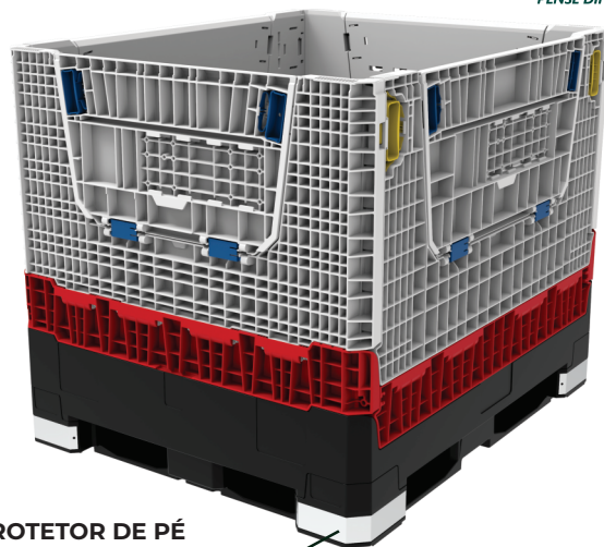
PROTECTOR DE PÉ (Opcional)