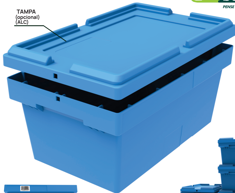
TAMPA (opcional) (ALC)