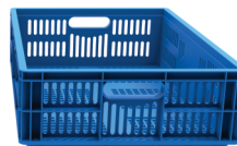
PERMITE CIRCULAÇÃO DE AR E VAZÃO DE LÍQUIDOS