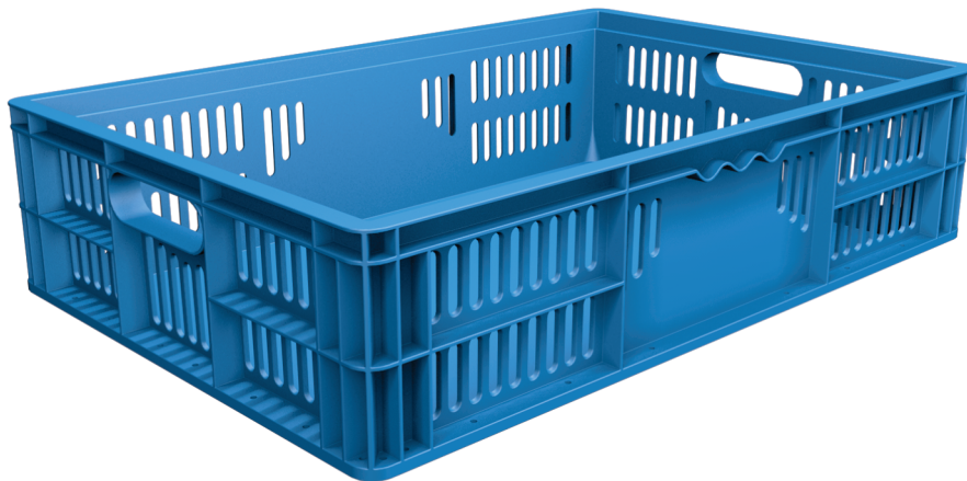
TRÊS TIPOS DE ALÇAS