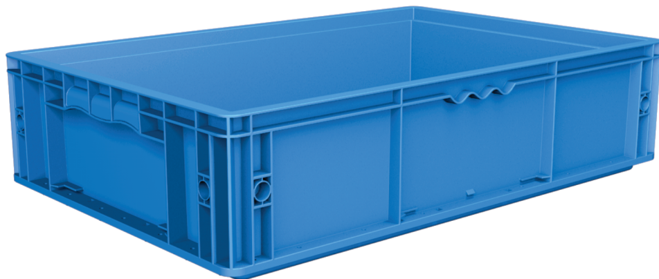
TRÊS TIPOS DE ALÇAS