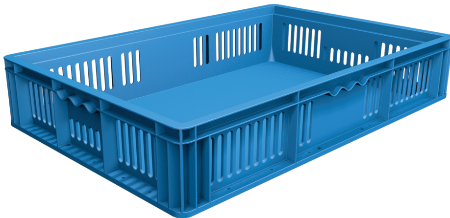
TRÊS TIPOS DE ALÇAS