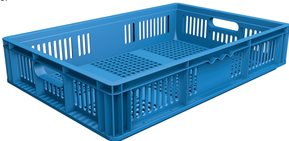
TRÊS TIPOS DE ALÇAS