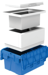
Cuba de PSAI