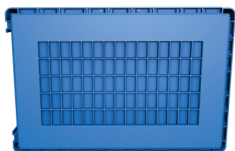
FUNDO HÍBRIDO Permite cargas mais pesadas