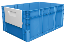
OPÇÃO COM PORTINHOLA